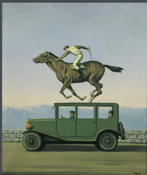
© Adagp, Paris 2016 © Photothèque R. Magritte / BI, Adagp, Paris, 2016

C'est en 1960 que René Magritte, artiste surréaliste d'origine belge, réalise l'œuvre Colère des Dieux .