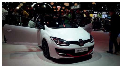
La nouvelle Renault Mégane Sport sur le stand Renault

Après deux longues années d'attente, le cru 2016 du Mondial de l'Auto de Paris, a été, encore une fois, un succès. Malgré une baisse d'affluence lors des deux semaines du salon, l'évènement, est parvenu, comme tous les deux ans, à satisfaire tous les fans. Au programme cette année, beaucoup de nouveautés, surtout dans le domaine de l'électrique. En effet, pour la première fois au salon, le constructeur Tesla était présent. Quant aux constructeurs germaniques comme Opel avec son Ampera-E ou encore Porsche avec sa Panamera 4 E-Hybride, l'électrique a résolument été le thème principal de cette année 2016. Au fil des halls, la technologie était au rendez-vous, mettant la réalité virtuelle au premier rang, comme sur le stand de Seat ou encore celui de Coyote, l'assistant à la conduite communautaire. Certaines grandes marques telles que Ford, Bentley, Aston Martin ou encore Rolls-Royce, n'étaient pas présentes à l'évènement, pour des raisons de communication.