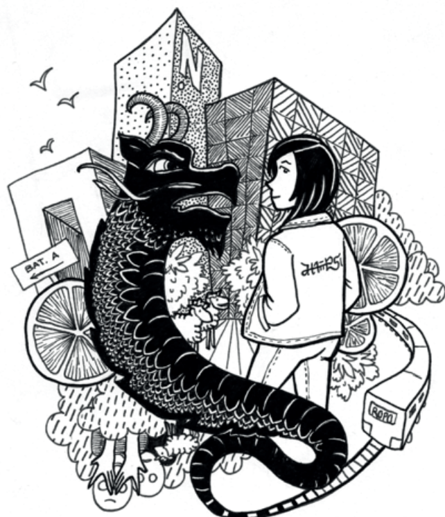
Illustration de : Marie Clech