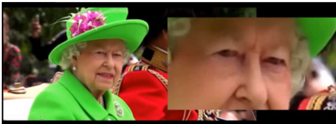
LA REINE ÉLISABETH II SE TRANSFORMANT EN REPTILE, AOÛT 2016.

La reine d'Angleterre a eu 90 ans en avril et nous sommes en droit de nous demander : cette longévité est-elle fortuite ? Pour David Icke, journaliste sportif et polémiste à ses heures, cela prouve qu'elle est une reptilienne. Pour ce théoricien du complot, la plupart des dirigeants du monde sont des reptiliens qui prennent une apparence humaine afin de dominer notre espèce. En cherchant bien, les preuves sont nombreuses qui viennent justifier cette théorie. Un témoignage de Lady Diana dans lequel elle se serait plainte que tous les membres de la famille royale d'Angleterre étaient des reptiliens, refait ainsi surface bien des années après sa mort.